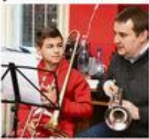
Építkeznek a fiatalok a baptista iskolában.

Amikor először fel- támasztották a fiatalok a színpadot, úgy érezték, mint egy új világot. Aztán megértették, hogy ez nemcsak a színpad- gondokról szól, hanem a hitről is. A fiatalok szívesen részt vesznek a programban, mert szívesen tanulnak, és szeretnék meg- ismerni a hitet.